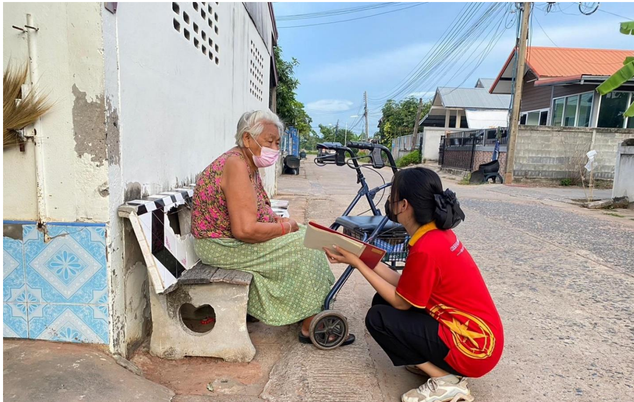
ภาพที่ 5.2 ทีมงานนักวิจัยลงพื้นที่แจกแบบสอบถามในเขตองค์การบริหารส่วนตำบลดอนหัน อ.เมืองขอนแก่น (2)