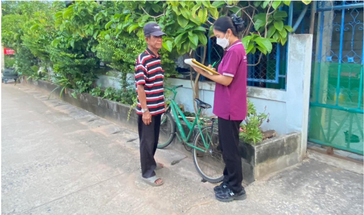
ภาพที่ 5.7 ทีมงานนักวิจัยลงพื้นที่แจกแบบสอบถามในเขตองค์การบริหารส่วนตำบลดอนหัน อ.เมืองขอนแก่น (6)